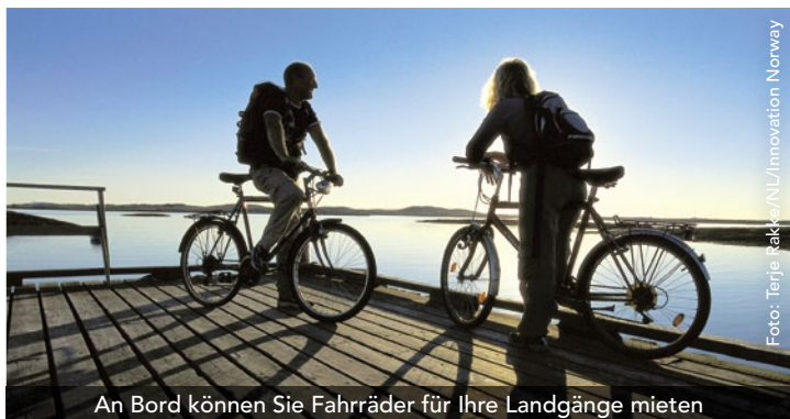
An Bord können Sie Fahrräder für Ihre Landgänge mieten