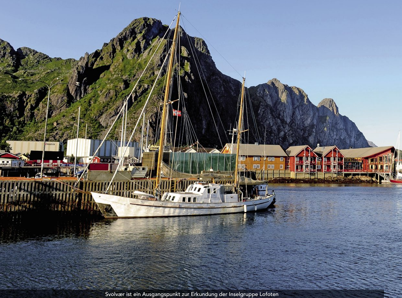
Svolvær ist ein Ausgangspunkt zur Erkundung der Inselgruppe Lofoten