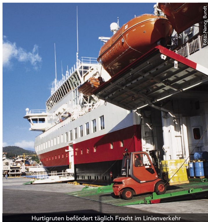
Hurtigruten befördert täglich Fracht im Linienverkehr